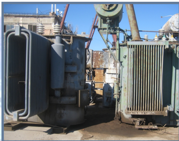
Ответственность Кызылординской региональной электросетевой компании за загрязнение трансформации