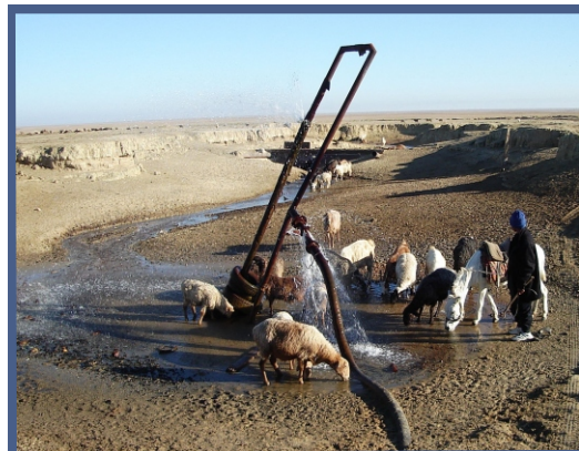
ОВОС местор. Равнинное столкнулся с увеличивающимися стадами, вокруг самоизливающейся скважины. Ее закрытие приведет к потере доходов местного населения.

В 2015г Казахстан расширил доступ общественности к информации, обязав гос. органы и другие организации, предоставляющие публичную информацию (национальные холдинги, монополии, ГЧП) раскрывать не только экологическую, но всю информацию, не являющуюся государственной, врачебной или коммерческой тайной.