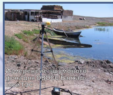
Измерение шумового фона для ОВОСС Балхашской ТЭС

ТЭЦ АТЫРАУНЕФТЕМАШ является удачным примером надежного и эффективного источника энергии, использующий попутный газ на нефтяных месторождениях отдаленных от энергосети, развитию которых мешали высокие цены на подключение. Отчет был сфокусирован на утилизации тепла, соответствии уровня эмиссий NOx Директивам ЕС и влиянии на местные распределительные компании и потребителей