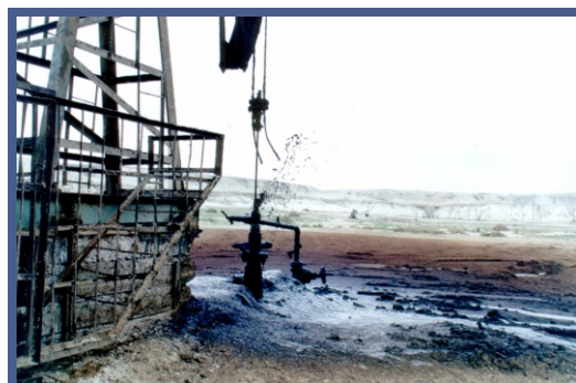
Утечка нефти на месторождении с экологическими и финансовыми последствиями