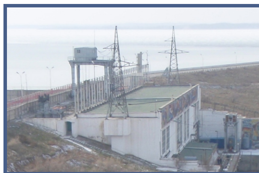
Шардаринская ГРЭС: разрешение вопросов подтопления полей и миграции рыб.