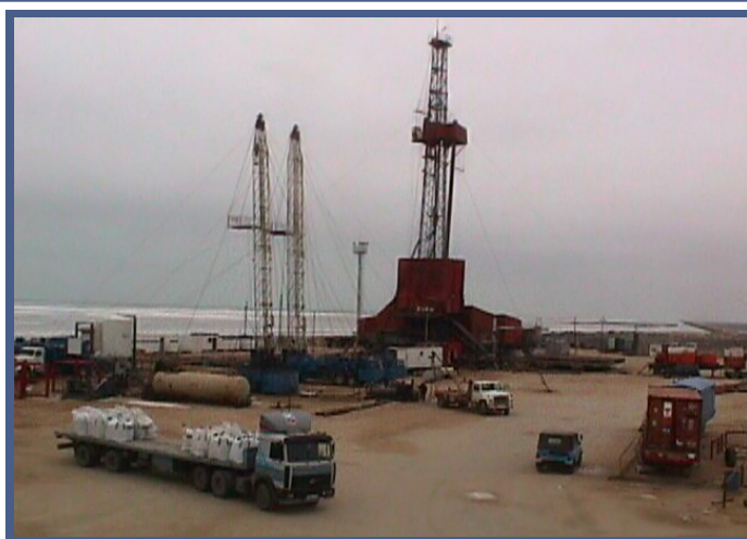
Месторождение Арман: Аудит с Walsh Environmental (США) для нефтегазовой корпорации Kerr-McGee