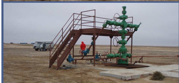
Месторождение Равнинное: аудит соответствия и ОВОС 3D сейсморазведки, расконсервации скважин и тестирования. для предоставления в AIM, London Stock Exchange