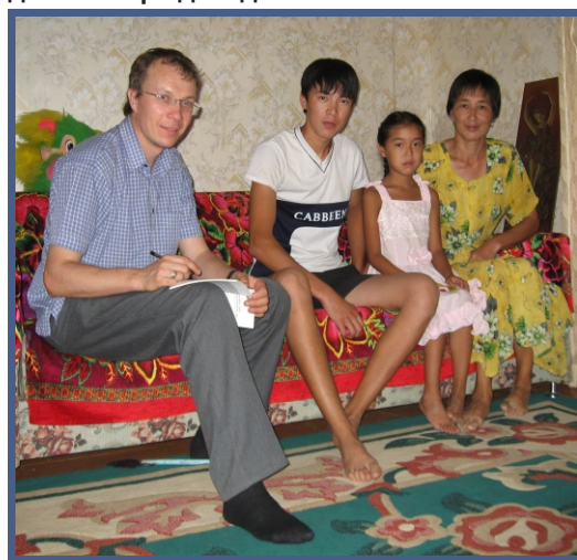
Эта семья не знает о рисках проживания у нефтяного терминала Ганюшкино и не хочет переселяться.